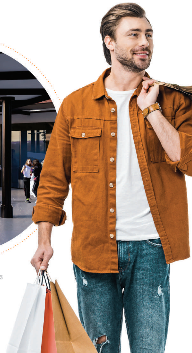
Área Ilustrada do corredor de serviços