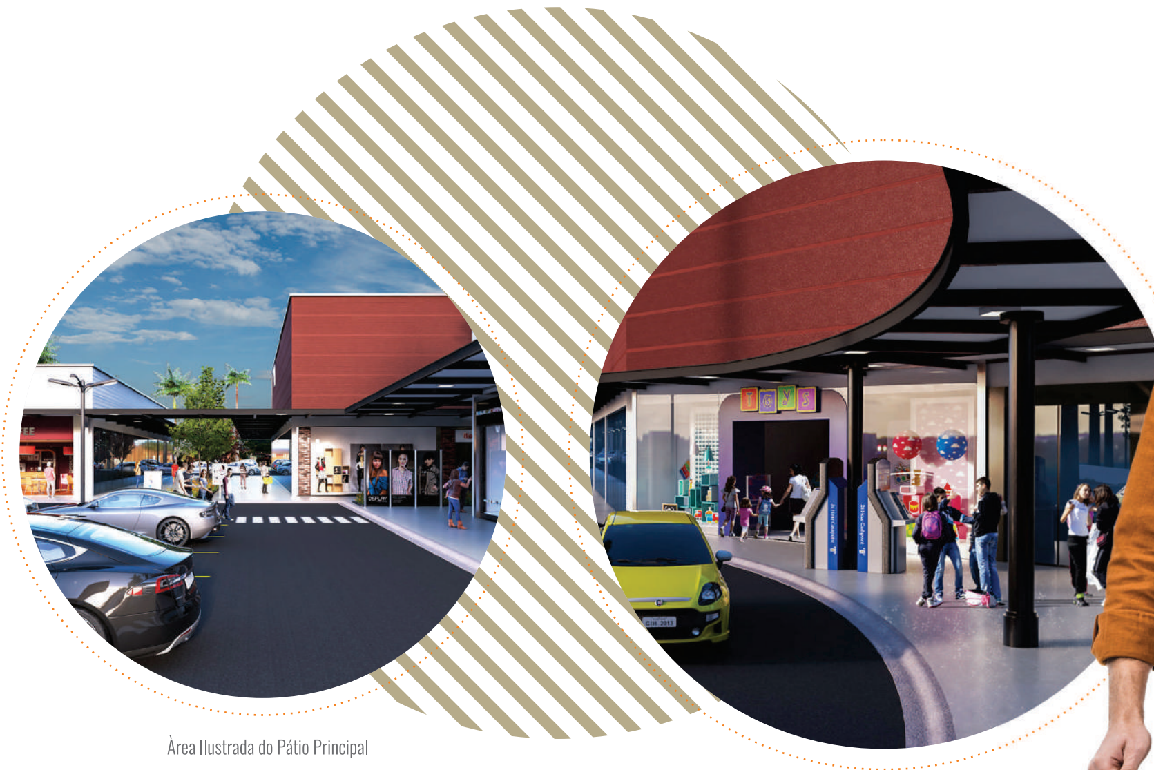
Área Ilustrada do Pátio Principal