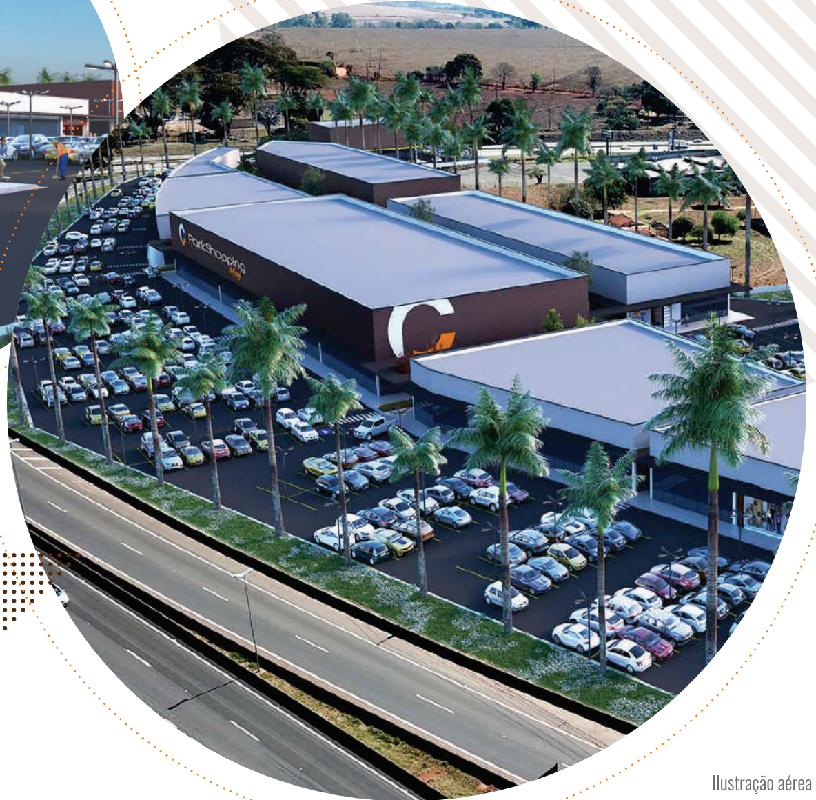
Ilustração aérea do projeto